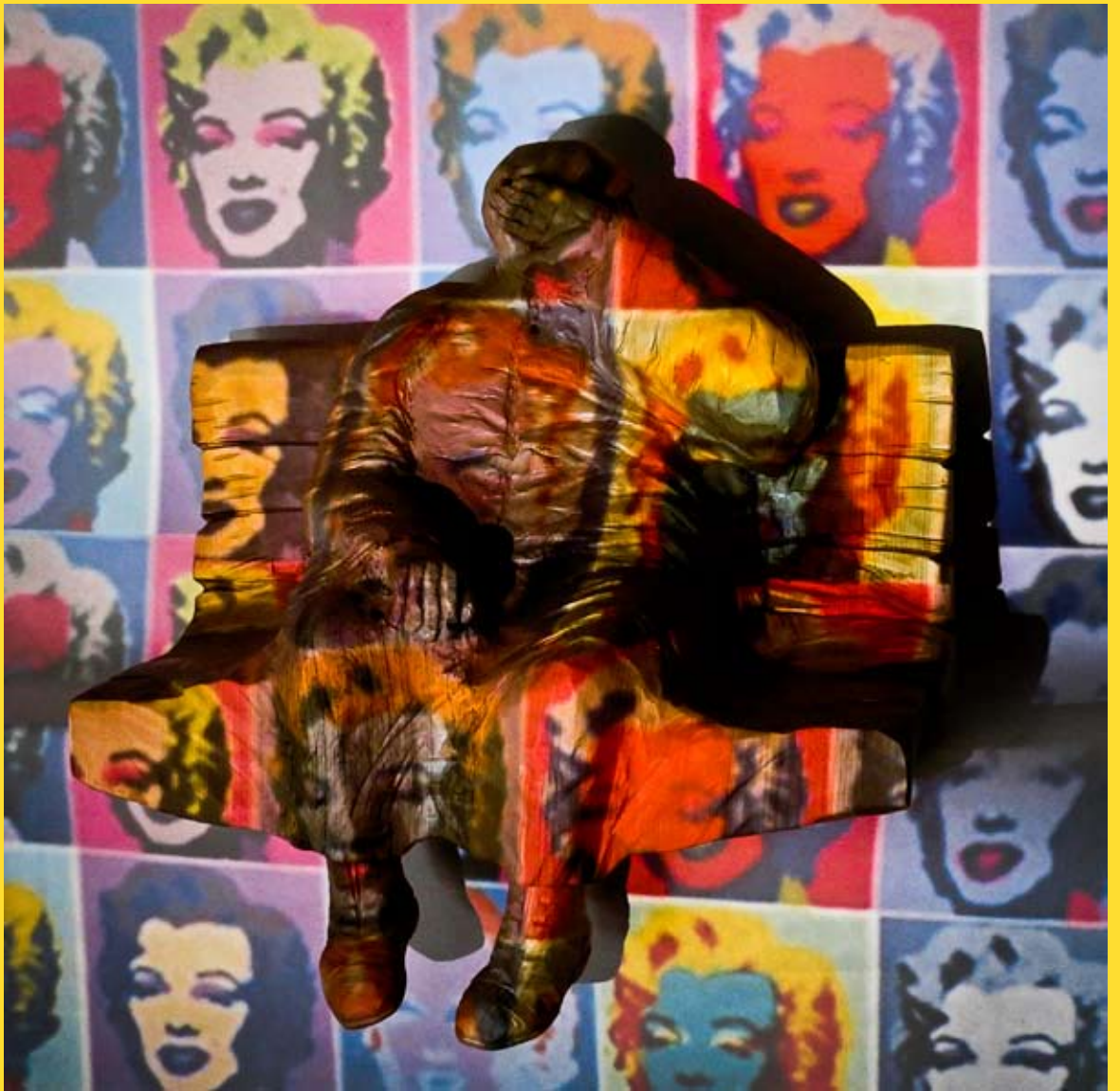
Paradosso sospeso 2011 - legno di cirmolo, fotografia cm 50 x 60 x 30