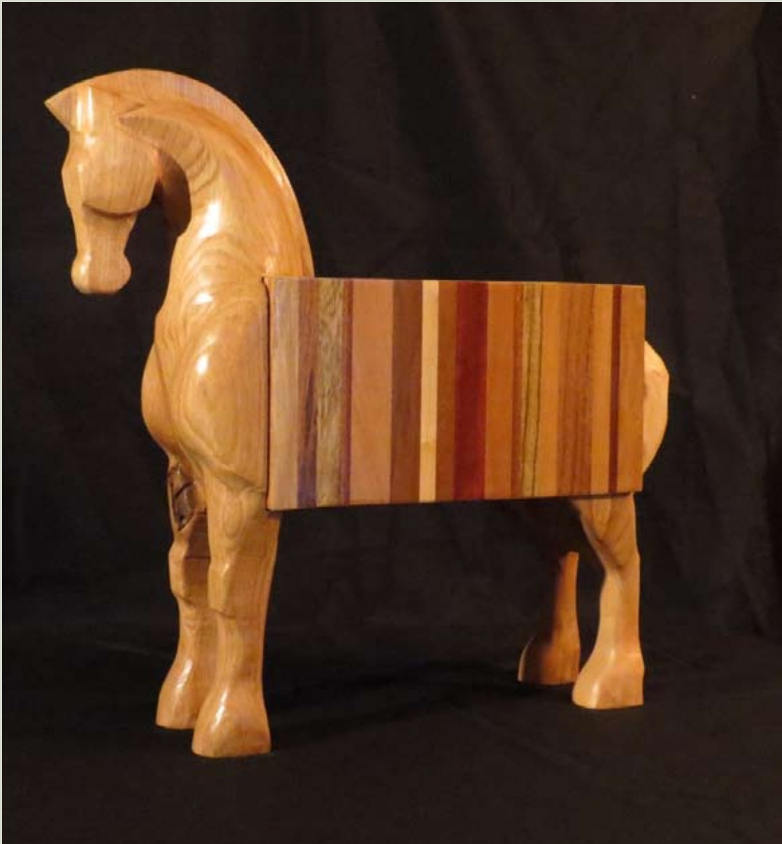
Mythos 2015 - vari legni pregiati cm 192 x 192 x 60