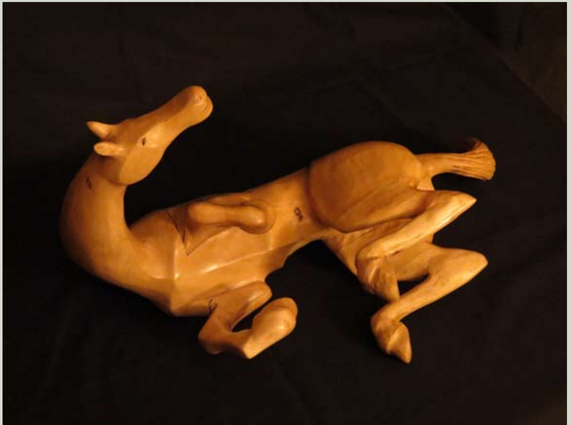
Calci al cielo 2008 - legno di acero cm 35 x 55 x 30