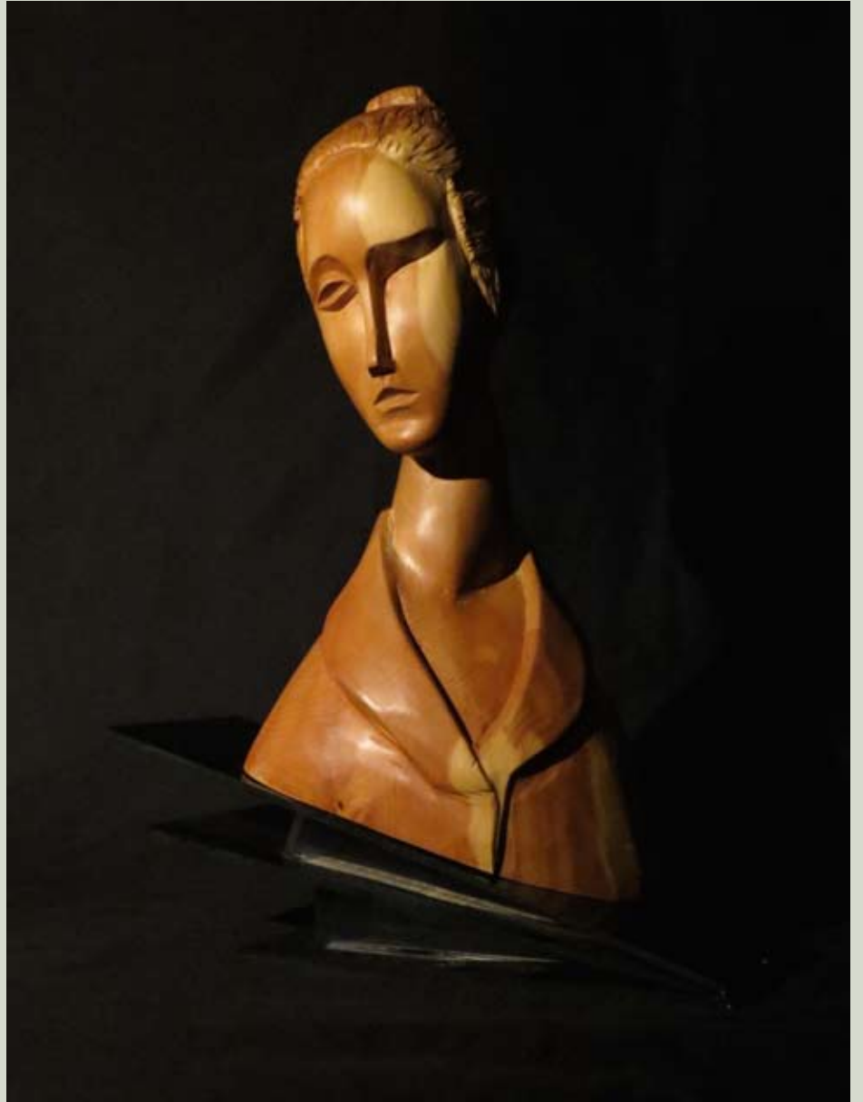
Instabile Musa II 2006 - legno di cirmolo, plexiglass cm 52 x 40 x 15